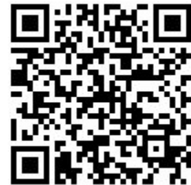
für Apple iPhone/iPad

3. Öffnen Sie die App und melden Sie sich mit unserer Bankleitzahl 75390000 und Ihrem VR-NetKey an. Vergeben Sie ein persönliches Anmeldekennwort mit diesen Mindestanforderungen: